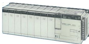
オムロン社製 C200H 及び α シリーズ